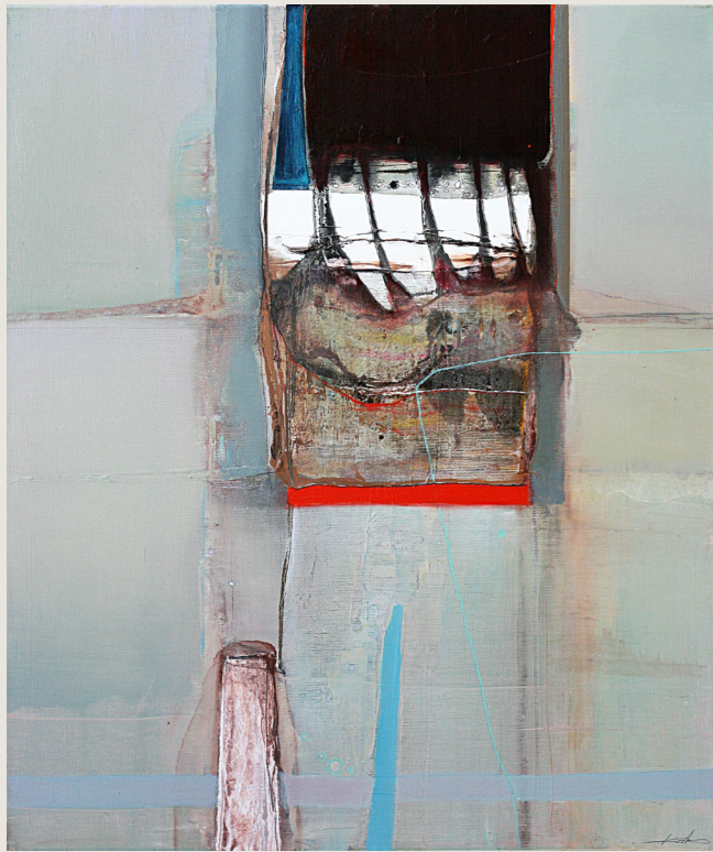
Raam, olie op doek, 70 x 60 cm