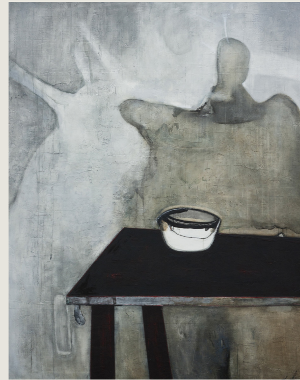
Angels Diner, 250 x 200 cm