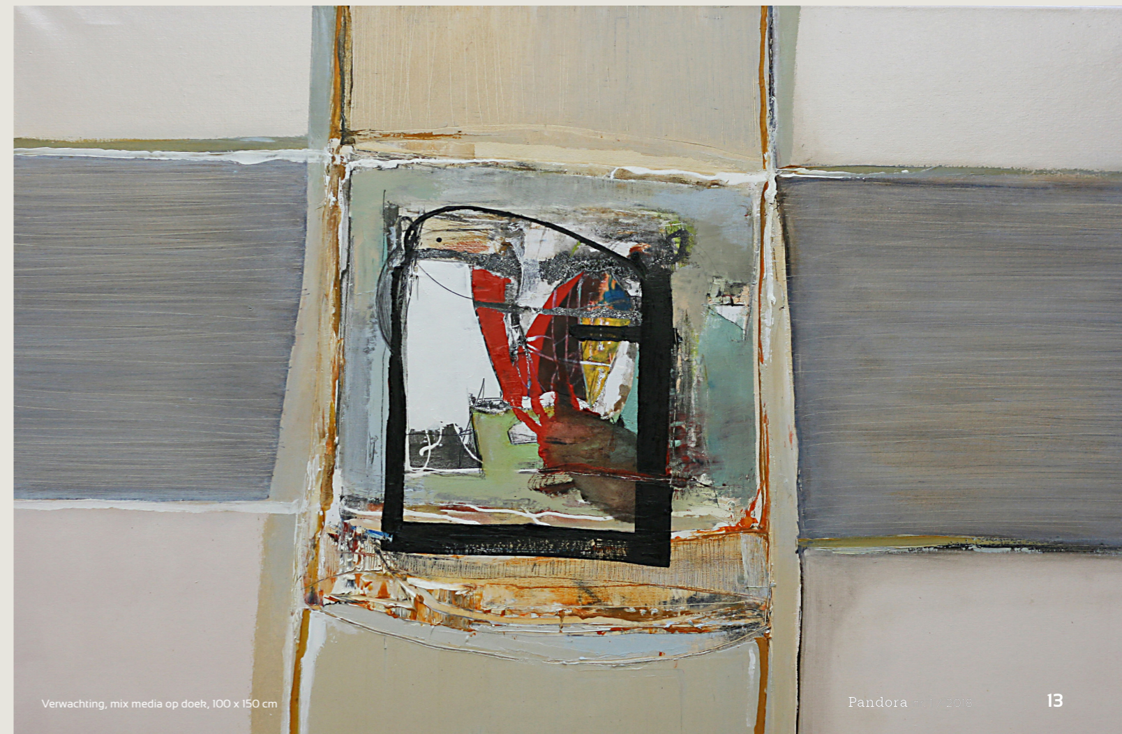
Verwachting, mix media op doek, 100 x 150 cm

Expositie: Galerie Delfi Form, Zwolle van 5 april t/m 5 mei.