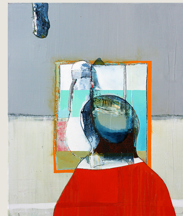
Verwachten, olie op doek, 70 x 60 cm

"Onder het communisme was het voor een Bulgaars kunstenaar heel moeilijk om in een ander land te exposeren. Ik wilde communiceren met een nieuw publiek, want kunst is internationaal. Ik las veel over de kunst in Europa en wilde het graag overal bekijken. Toen ik in Nederland kwam ben ik Rembrandt gaan bewonderen en natuurlijk ook Van Gogh. Dat was een emotioneel moment! Kunst is niet gebonden aan grenzen. Ik wilde overal kunnen exposeren, ik ben een kosmopoliet."