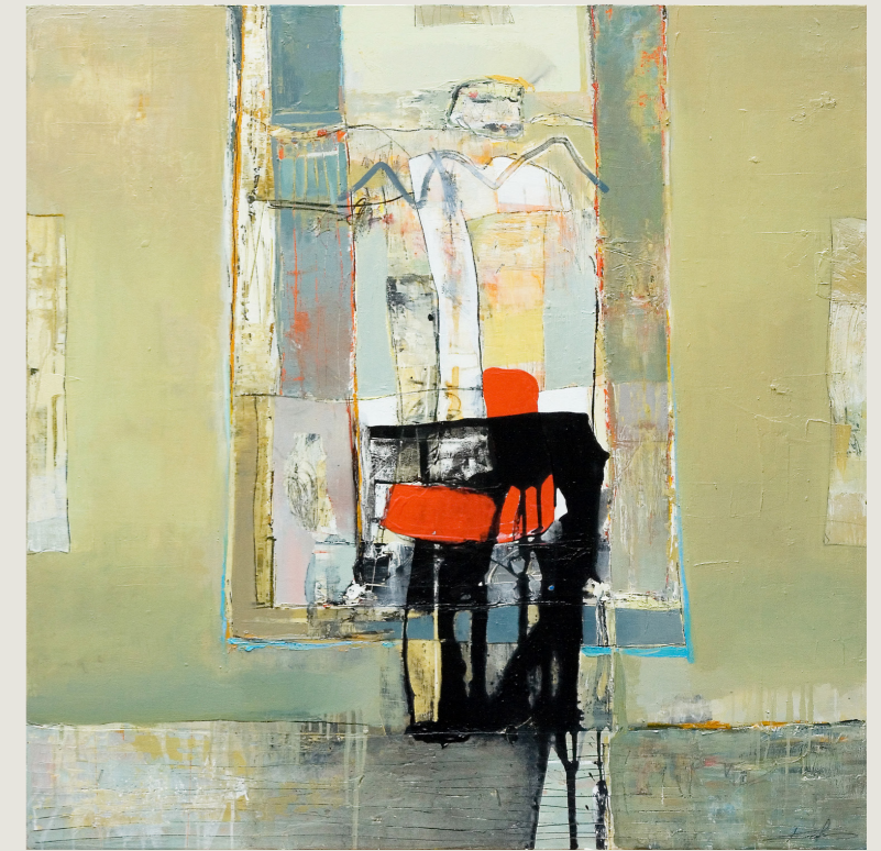
Path II, 100 x 100 cm