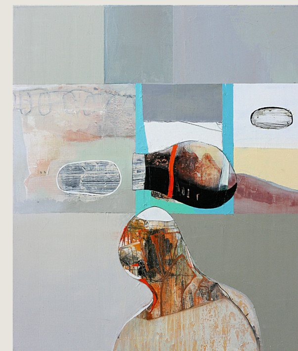
Contact, olie op doek, 70 x 60 cm