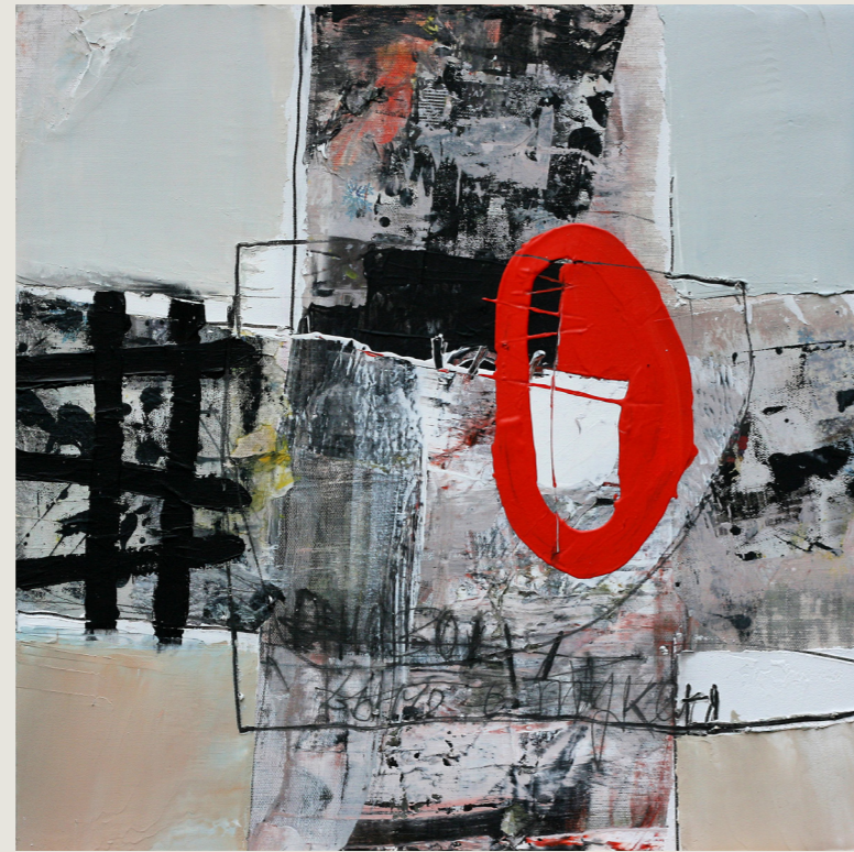
Back to memory 04, gemengde techniek op doek, 50 x 50 cm